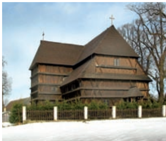
Hronek, evanjelický artikulárny kostol

Pri orientácii, ktoré predmety patria do tejto skupiny, je najlepšou pomôckou materiál, ktorý bol odovzdaný v rokoch 1993 až 1995 proti podpisu každému správcovi sakrálného objektu vtedajším Pamiatkovým ústavom (tzv. Celoplošná fotodokumentácia, realizovaná pamiatkarmi v spolupráci s policajným zborom). Ďalší exemplár tohto materiálu sa nachádza v príslušnom KPÚ. Materiál obsahuje identifikačné listy nielen všetkých hnutelných kultúrnych pamiatok