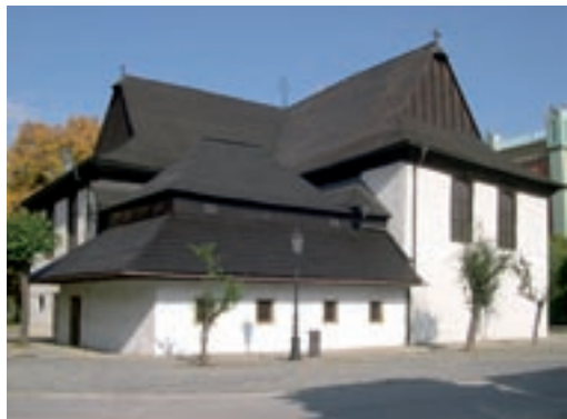
Kežmarok, evanjelický artikulárny kostol

Žiadosť o dočasný vývoz kultúrnej pamiatky predkladá žiadateľ na predpísanom tlačive (tlačivo je možné získať na stránke ministerstva kultúry http://www.culture.gov.sk/kulturne-dedicstvo/ochrana-pamiatok/formulre alebo priamo na ministerstve, prípadne ho môže vlastníkovi poskytnúť príslušný KPÚ).