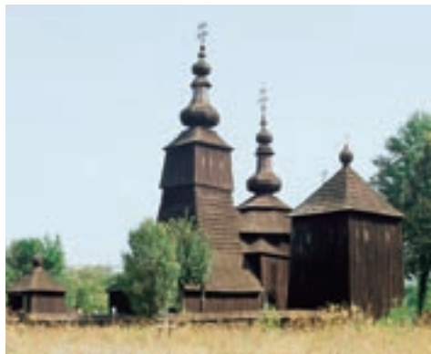
Ladomírová, Kostol sv. Michala archanjela

Oprávnení prijímatelia: verejné orgány a orgány, ktoré sa spravujú verejným právom a sú to orgány zodpovedné za ochranu kultúrneho dedičstva a krajiny.