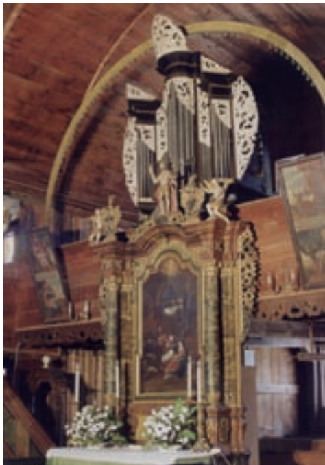
Interiér artikulárneho kostola v Hronseku

Možný je iba jej dočasný vývoz na základe povolenia Ministerstva kultúry SR po predchádzajúcom vyjadrení pamiatkového úradu, najdlhšie na tri roky (najčastejšie ide o dôvod reštaurovania alebo vystavovania). Ministerstvo môže vydanie povolenie viazať na určité podmienky (napr. poisťná zmluva).